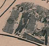
BBQにも参加してくれました!