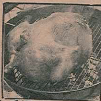
店長特製 七面鳥の丸焼き!