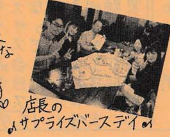
店長の サプライズバースデイ